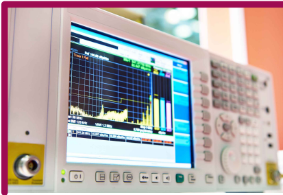
Receiver for measuring electromagnetic field